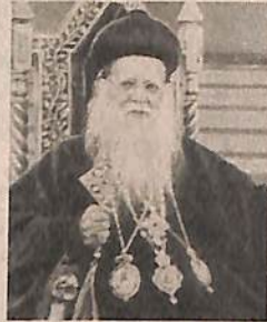
പ. മാത്യു മിശിയാസ് ഗീവർഗ്ഗീസ് റിതിയൻ കാതോലിക്കാ ബാവ